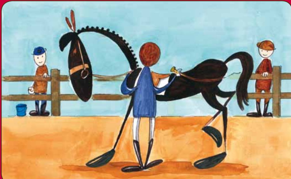
Grondwerk is niet toegestaan.