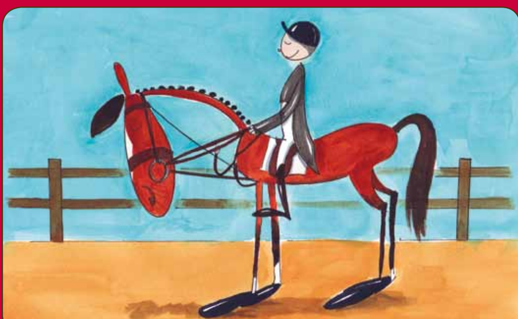
Hulp- of bijzetteugels zijn verboden, behalve bij het longeren (enkel vaste bijzetteugels zijn toegestaan).