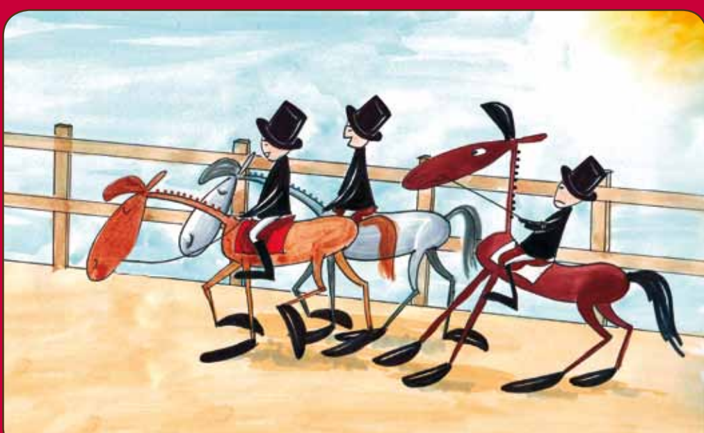
Zij aan zij stappen, halthouden om een praatje te slaan, ... is niet toegelaten.