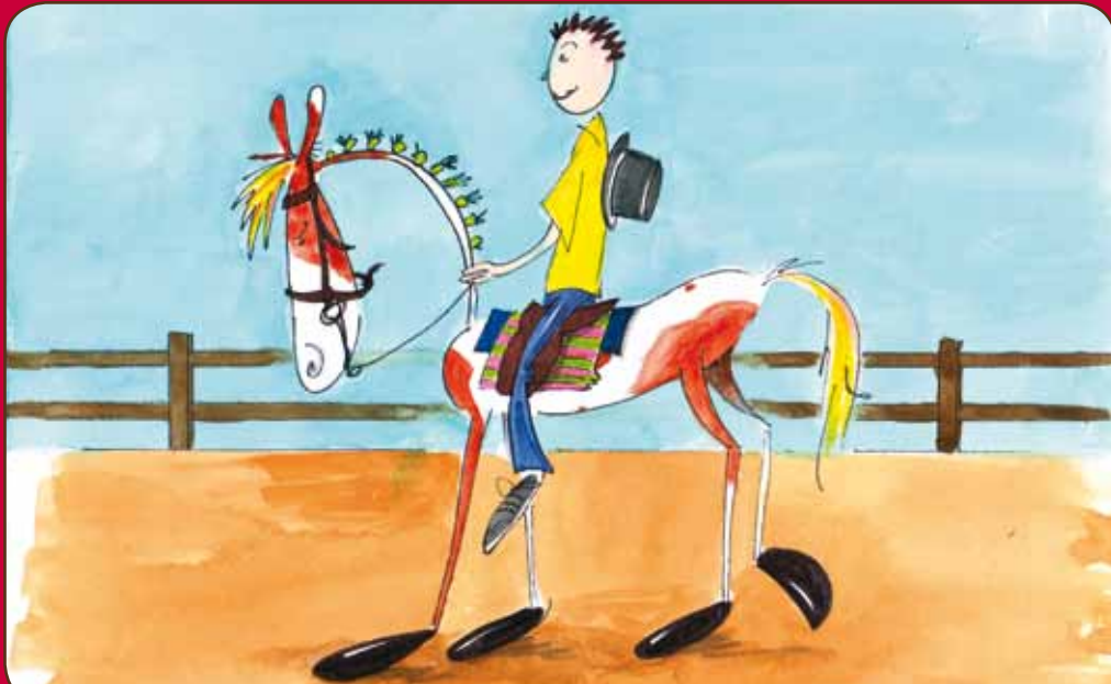
Alle ruiters moeten een rijbroek en rijlaarzen dragen.