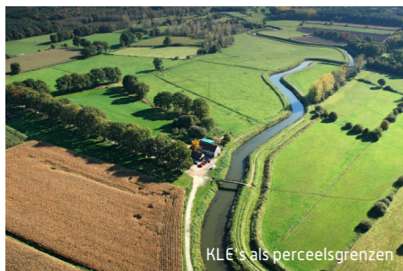
KLE's als perceelsgrenzen

In de Vlaanderen vind je verschillende streken. Bij elke streek hoort een landschapstype. Zo vind je boscomplexen, valleigebeden, open-, halfopen- en gesloten landschappen. Elk van deze landschapstypes is opgebouwd uit specifieke kleine landschapselementen (KLE's) zoals autochtone bomen, houtkanten, heggen, poelen, weiden en graslanden. Vroeger werden deze elementen gebruikt als perceelscheidingen, bron van gerief- of brandhout, oriëntatiepunten, veekering, extra schaduw en watervoorziening, maar ook vandaag bewijzen zij hun nut.