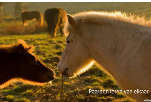
Paarden leren van elkaar

Paarden zijn kuddedieren die nood hebben aan gezelschap, beweging, voedsel en water . De weide is dé plaats bij uitstek waar paarden zich "thuis" voelen. Het is de natuurlijk biotoop van het gedomesticeerde paard. Paarden geven zelfs de voorkeur aan de relatieve vrijheid op de weide boven, het op het eerste zicht, hogere comfort in een stal of schuilhok.