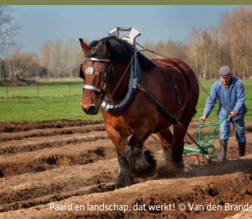
Paard en landschap, dat werkt!

De toename van het aantal paardenhouders biedt heel wat kansen voor biodiversiteit, ecologisch herstel en vrijwaring van waardevolle landschappen. Door streekeigen kleine landschapselementen te integreren, paardenweides als kruidenrijke graslanden te beheren en landschapsvriendelijke materialen te gebruiken, bent u naast paardenhouder, ook landschapsbouwer!