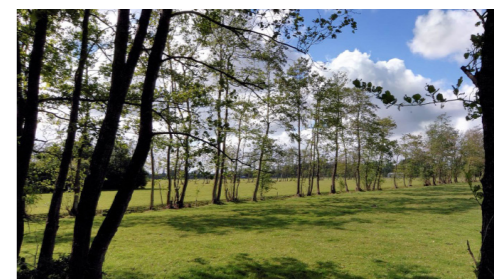
Dunne elzensingel rond weide