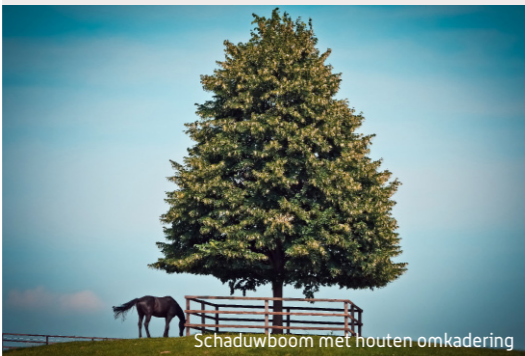
Schaduwboom met houten omkadering

-Door (knot)bomen en houtkanten te integreren zorg je voor beschutting tegen zon, regen en wind. Je geeft structuur aan het landschap en bezorgt andere dieren voedsel- en schuilmogelijkheden.