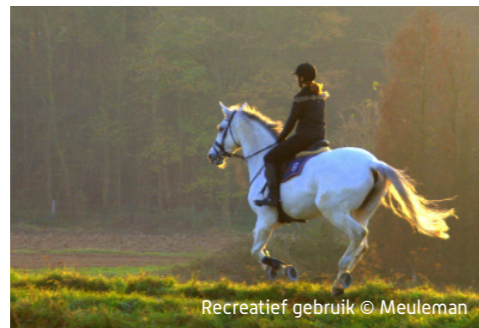
Recreatief gebruik

merkbaar. Er is een enorme toename van versnipperde percelen en het opduiken van schuilhokken, rijpistes, ruiterspaden, maneges, jumpingconstructies, lichtbakken en afrasteringen. Het veranderd landgebruik en het beheer van graasweiden heeft bovendien een niet te onderschatten impact op de biodiversiteit, de waterhuishouding en de groenstructuren van Vlaanderen. Het is dan ook cruciaal deze landschappelijke transformatie op een verantwoorde manier in te passen binnen onze steeds schaarser wordende open ruimte.