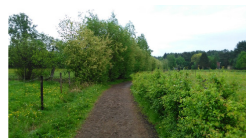
Meidoornhaag rond weide