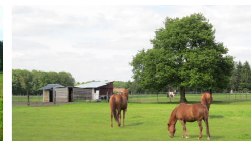
Schaduwboom in paardenweide