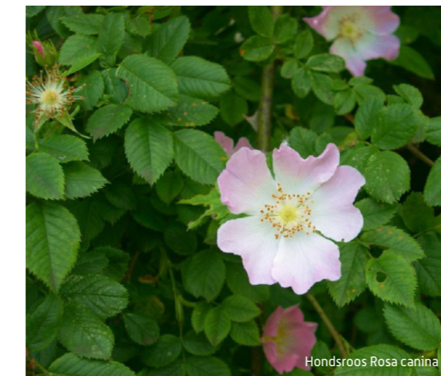
Hondsroos Rosa canina