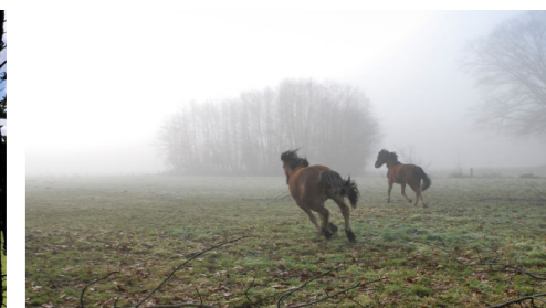
Ruimte om te bewegen